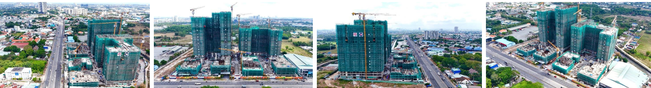
Hình ảnh được cập nhật ngày 27/05/2026